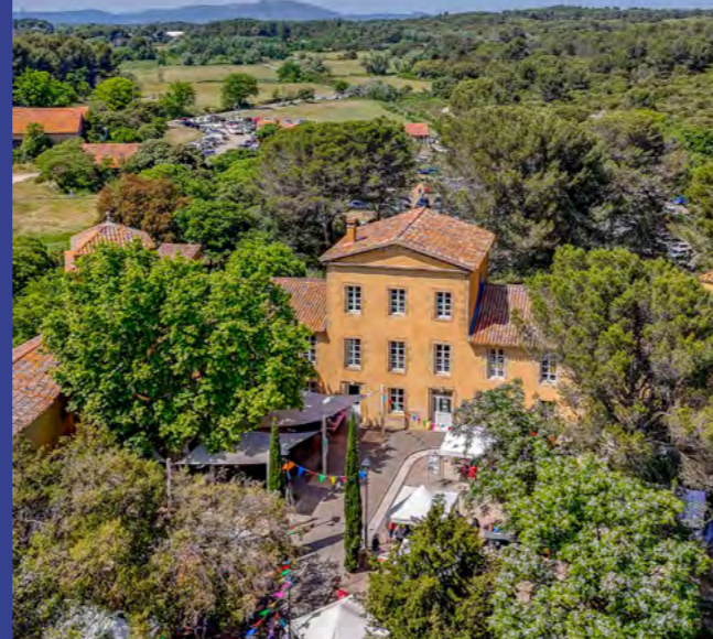
La cuisine de l'essentiel