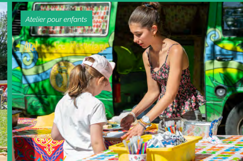
Atelier pour enfants