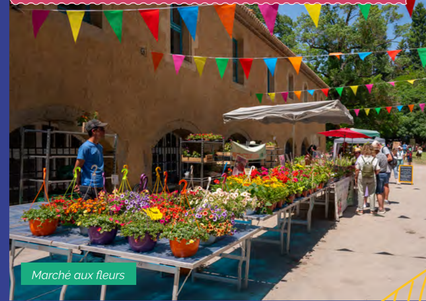
Marché aux fleurs